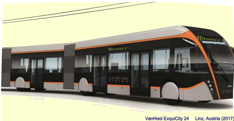
VanHool ExquiCity 24 Linz, Austria (2017)